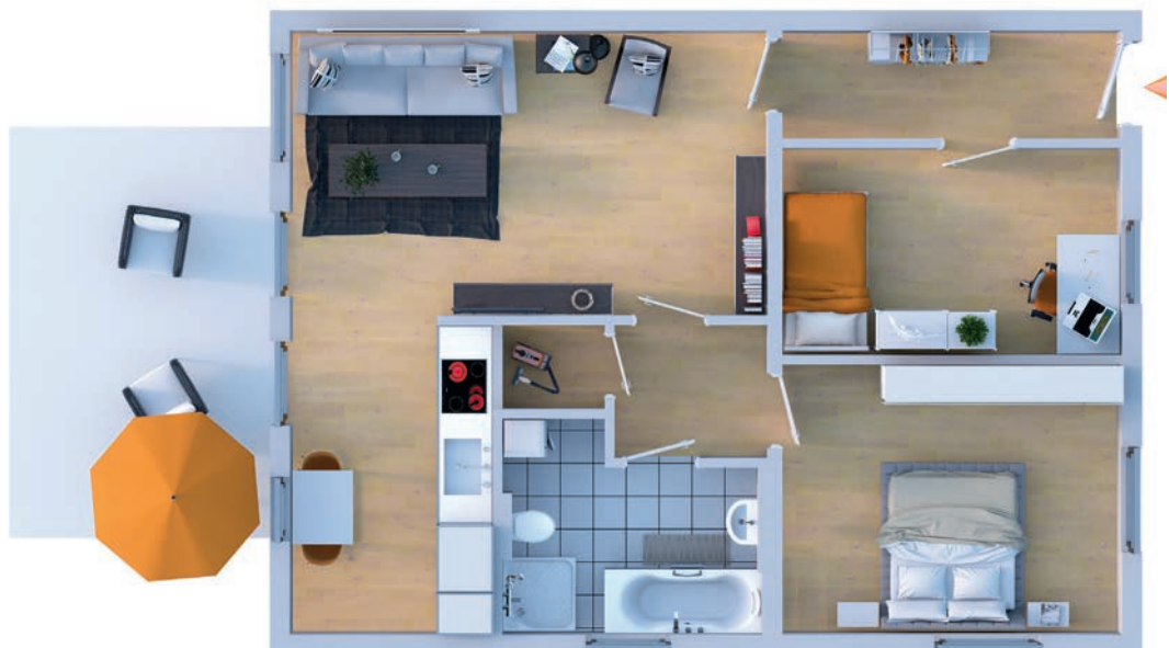
Beispielgrundriss einer 3-Raum-Wohnung mit circa 76 m 2

Zu jeder Wohnung gehören ein eigener Pkw-Stellplatz in Form eines überdachten Carports sowie ein verschließbarer Abstellraum.