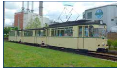
Triebwagen 101 + Gotha-Beiwagen 155 + Reko-Beiwagen 207