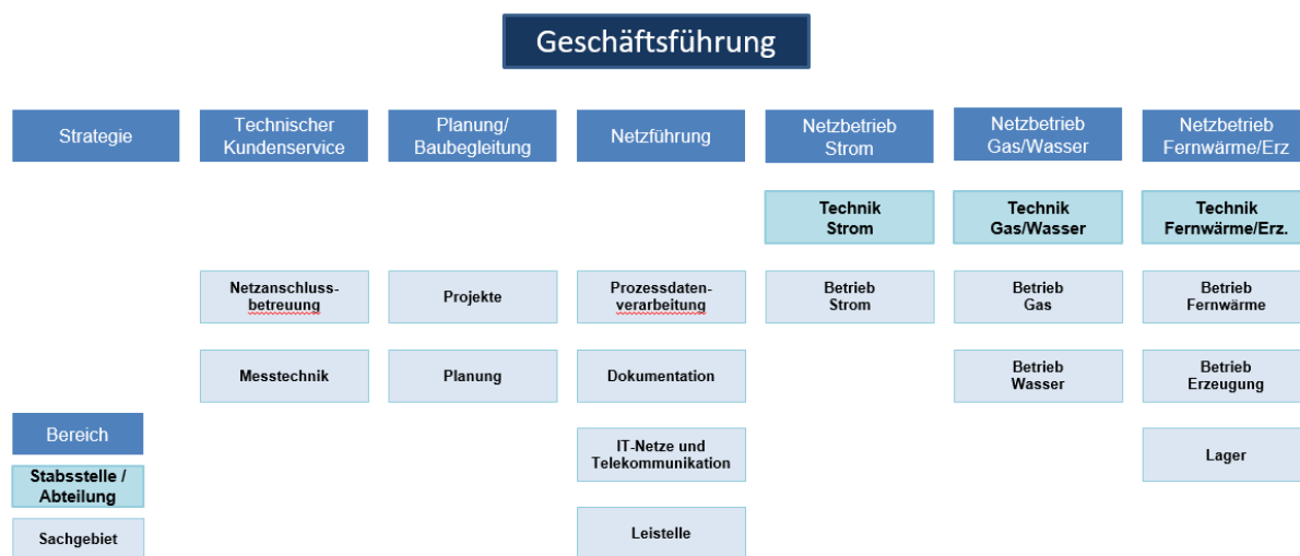
Abbildung 2 Organisation der Stadtwerke Jena Netze (Stand 31. Dezember 2019)

Die Aufgaben der Leitung und Letztentscheidung für die Stadtwerke Netze werden vollständig durch eigenes Personal erfüllt.