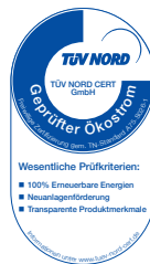
Stadtwerke Energie Jena-Pößneck jenaturStrom

Übrigens: Unser jenaturStrom ist TÜV-zertifiziert.